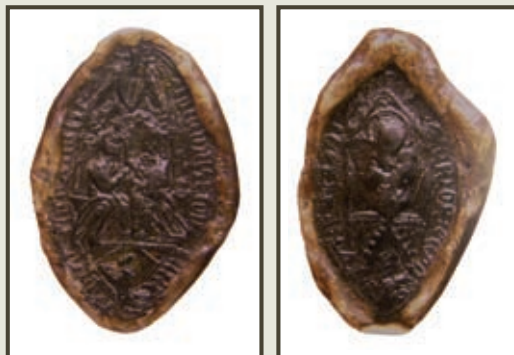
Odciski pieczęci konwentu klasztoru augustianów w Strzelcach